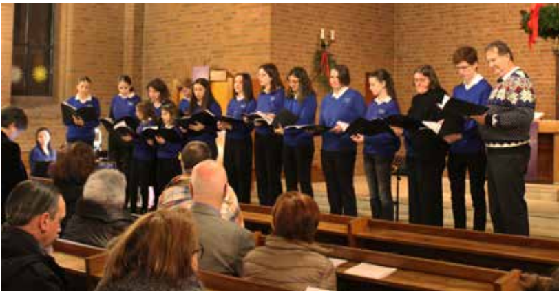
Doremi Konzert Dezember 2024