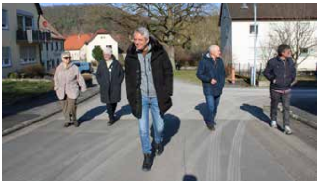
Betriebsausflug Pfarramt Matthäusgemeinde