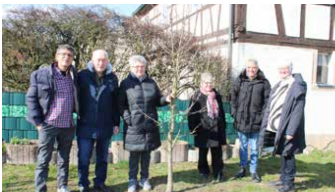
Betriebsausflug Pfarramt Matthäusgemeinde