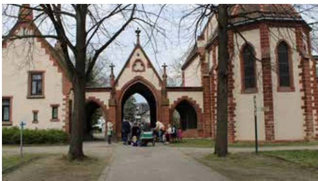
KiGo auf dem Friedhof