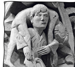
Kapitell der Kathedrale von Vézelay.

Di, 29.4., 15h Café Johannes – Offener Treff für Alt & Jung Neues Souterrain